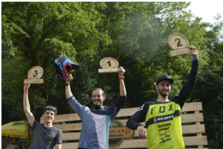
Πανελλήνιο Κύπελλο Downhill 2018 Rock & Roll Trail, Μουζάκι, 20/5

Συντάχθηκε απο τον/την Timos Tsin. Τετάρτη, 30 Μάιος 2018 00:28